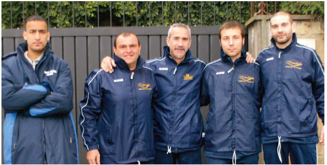
LA SQUADRA DELLA NUOVA ATLETICA LARIANO ALLA 36ESIMA EDIZIONE DELLA "ROMA OSTIA"

Dopo tanta pioggia finalmente un pò di "sereno": domenica 28 febbraio è partita la 36a edizione della famosa "Roma Ostia" che lascerà il segno in quanto ha superato i record delle mezze maratone: 10000 i runners al via, 8520 al traguardo dei quali 1130 donne. E al via presenti personaggi famosi come Giannichedda Giuliano e Gianni Morandi che terminano la gara regolarmente nonostante un forte vento che ha infastidito gli atleti per tutta la gara soprattutto nel tratto finale sul lungomare di Ostia. Alla partenza quattro gli atleti della Nuova Atletica La-