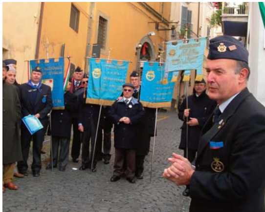
SKOF DURANTE UNA MANIFESTAZIONE

L'organizzazione è affidata all'assessorato alla Cultura in collaborazione con la sezione di Velletri, dell'Associazione Arma Aeronautica. Il convegno sarà curato e seguito dal Colonnello Giancarlo Bonelli e del Colonnello Massimo Morico, notiissimi meteorologi della televisione presenti in più trasmissioni sulle