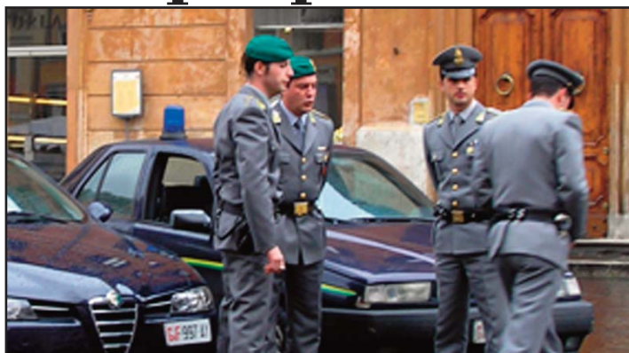
L'OPERAZIONE È STATA SVOLTA DALLE FIAMME GIALLE

LARIANO - E' scontro sulle sanzioni per chi non presenta le dichiarazioni