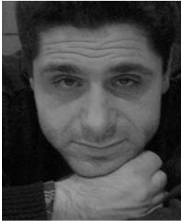
di Marco Audino

teressati. Ma qui abbiamo una coalizione che rappresenta la maggioranza dei cittadini che viene esclusa - a torto o a ragione, non è importante - dalla possibilità di ricevere voti... Un po' come girare un film su Zorro senza... Zorro... Fuor di battuta, la democrazia sarebbe messa seriamente in pericolo se questo fosse confermato - cosa che credo non sarà - anzi, assumerebbe i contorni di una specie di "golpe bianco" un ribaltamento delle forze in campo senza rivoluzione e scontro diretto, "bianco" appunto. Non ha infatti senso che la Bonino vinca senza