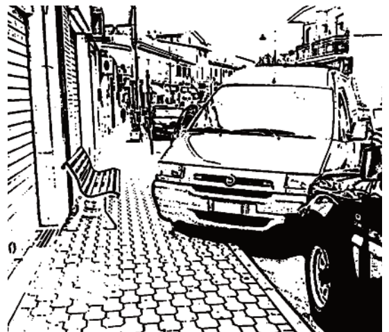
E IL PARCHEGGIO SELVAGGIO DILAGA

L'organizzazione è affidata alle associazioni venatorie di Velletri e Lariano