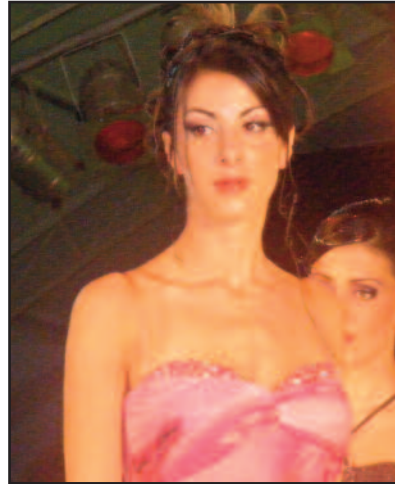
DEFILÉ MODA, MODELLE CON ABITI DI PENELOPE ABBIGLIAMENT