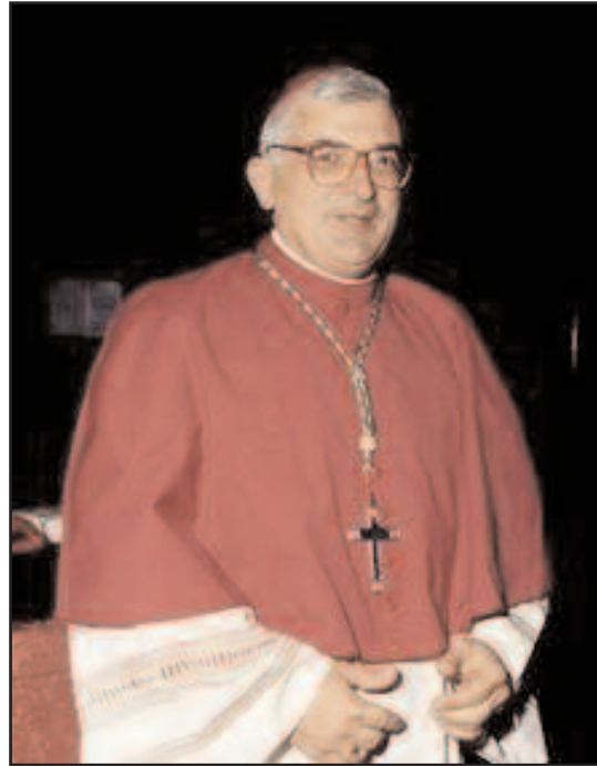
IL VESCOVO, S.E. VINCENZO APICELLA

Le conferenze sono state introdotte dal Vescovo Mons. Vincenzo Apicella che, martedì, al momento di fare un bilancio di quanto fatto dalla Chiesa a partire dal Documento Base del Concilio Vaticano II, si è così espresso sull'operato delle parrocchie: "Ricordo che 40 anni fa - ha affermato S.E. Vincenzo Apicella -, quando per la prima volta lessi il Documento Base, mi rimase impressa una frase che penso non avevamo capito allora e non abbiamo capito ancora oggi. La frase affermava che prima della catechesi vengono i catechisti e prima dei catechisti vengono le comunità parrocchiali. Ciò significa che la catechesi è inutile senza dei bravi catechisti ma anche il catechista non