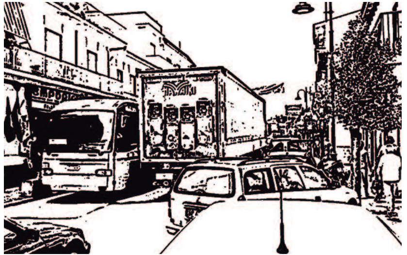
SEMPRE PIÙ ARDUO PER DUE MEZZI PESANTI TRANSITARE PER LARIANO