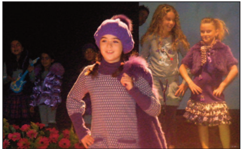
DEFILÉ MODA, ABITI DI GIAC BOYS