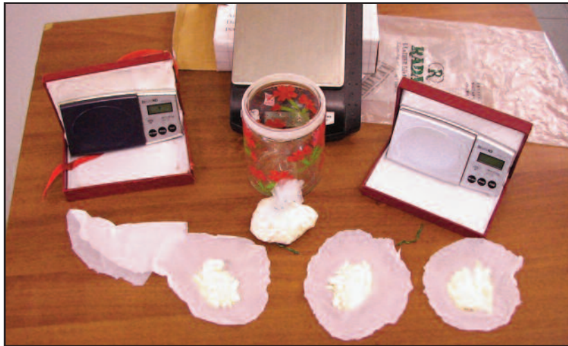
LO STUPEFACENTE SEQUESTRATO DALLA FINANZA

La Guardia di Finanza mette a segno un altro colpo contro lo spaccio ed il traffico di droga nei Castelli Romani. A finire in manette è un imprenditore agricolo di Velletri, denunciate altre tre persone. Il bilancio dell'operazione "Pollicino" (il nome viene dalla minuziosità delle indagini) parla di 120 grammi di cocaina sequestrati insieme a materiali da taglio e confezionamento, e 500 semi di marijuana. Una parte consistente del materiale posto sotto