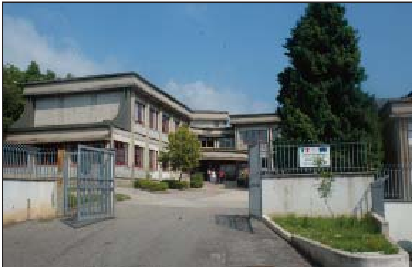
LA SCUOLA MEDIA DI LARIANO E (SOTTO) I CRITERI UTILIZZATI PER LA FORMAZIONE DELLE GRADUATORIE

quanto viene affermato nella scuola, sembra che le vecchie graduatorie, contro le quali a lungo si è battuto un Comitato dei genitori, fossero state fatte senza rispettare i criteri stabiliti mesi addietro dal Consiglio d'Istituto, generando così malumori e incomprensioni. Sarebbe così per questo motivo che tra le graduatorie