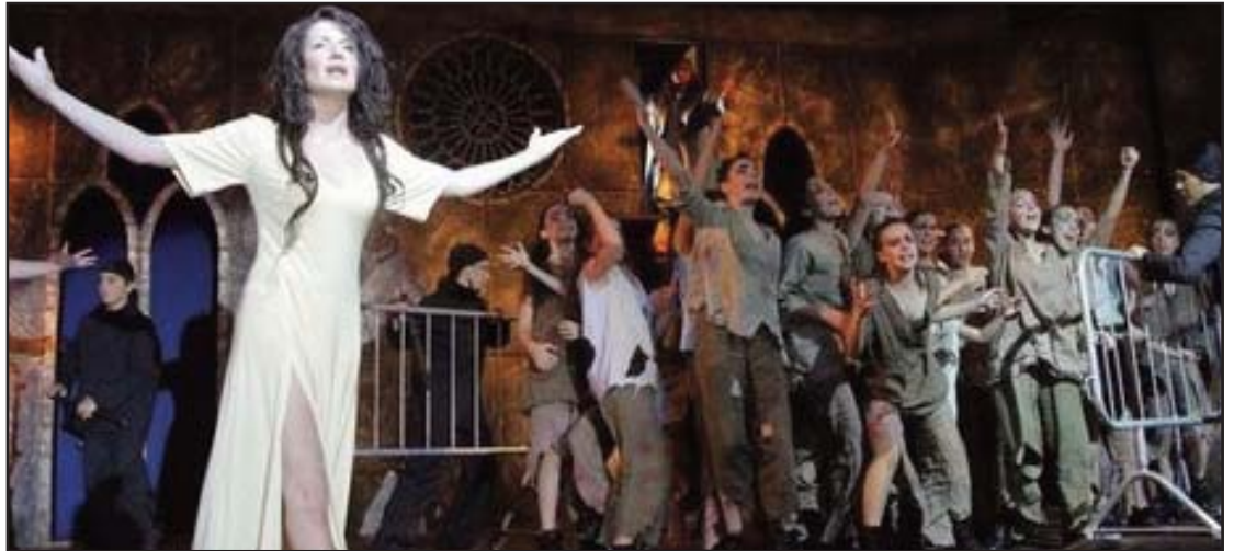
UN'IMMAGINE DI NOTRE DAME DE PARIS