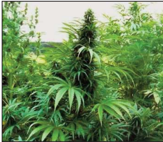
PIANTE DI CANAPA INDIANA

I Carabinieri del N.O.R. (Aliquota Radiomobile) della Compagnia di Velletri, hanno arrestato due fratelli, rispettivamente di anni 34 e 30, entrambi residenti a Velletri ed incensurati, in quanto nel giardino della loro abitazione hanno rinvenuto sei piante di marijuana per complessivi 750 grammi circa, da loro coltivate. I due sono stati posti a disposizione della magistratura mentre la droga è stata sequestrata. Nel corso del mese di agosto, i Carabinieri del Gruppo di