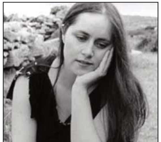
LASAIRFHIONA NI CHONAOLA

Raicín (pronunciato un Rackeen Ah-lyn), nel 2002 al Festival Interceltique di Lorient, Bretagna e lo stesso è stato selezionato dalla rivista musicale "Hot Press" come uno dei migliori album di folk del 2002. Visti i presupposti, non mancate ad un evento unico da non perdere.