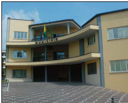
IL PALAZZO COMUNALE DI LARIANO