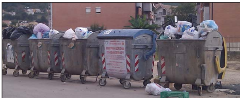
CASSONETTI PIENI IN VIA VALLE DELL'OSTE

Mercoledì prossimo è giorno di Consiglio comunale. I Consiglieri di Artena si riuniranno presso l'ex Granaio Borghese per discutere lo stato d'attuazione del bilancio di previsione 2010 e dei relativi equilibri di bilancio. All'ordine del giorno, inoltre, vi è il riconoscimento della legittimità dei debiti fuori bilancio contratti dall'Ente, cioè di quelle spese che sono state fatte malgrado non fossero state previste all'inizio dell'anno nel bilancio di previsione. Il Consiglio è dunque convocato in prima convocazione per il 15 settembre