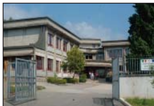
LA SCUOLA MEDIA DI LARIANO