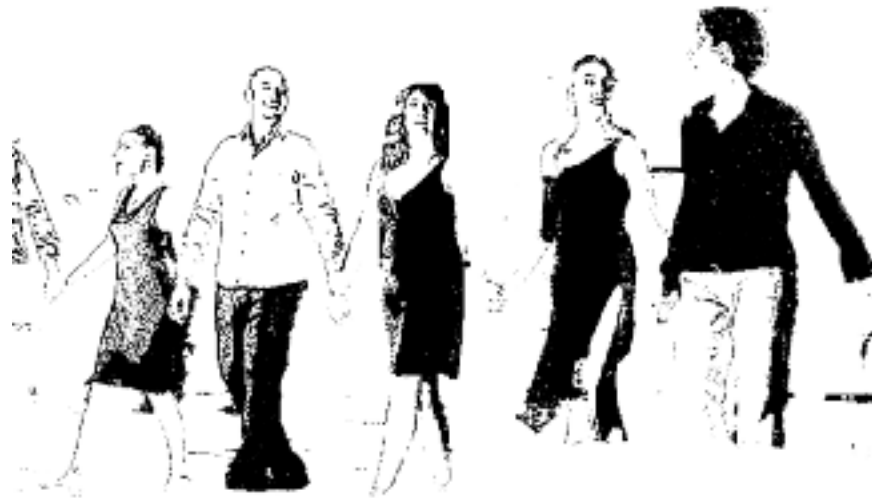
GLI ARTISTI RINGRAZIANO LA FOLLA DELLA CALOROSA PARTECIPAZIONE