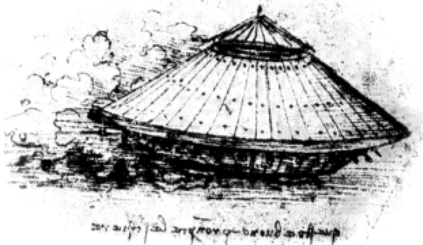
IL CARRO ARMATO PROGETTATO DA LEONARDO

Ospitata in una location di 800 mq di superficie, l'esposizione è aperta tutti i giorni e il prezzo