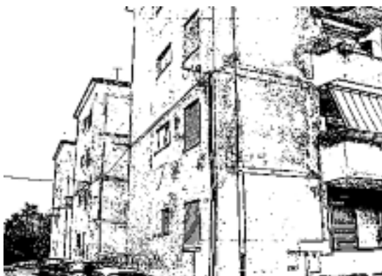
UNA VEDUTA DELLE CASE POPOLARI DI VIA MANZONI

I residenti di via Manzoni si riuniscono per trattare la vendita delle case comunali con l'Amministrazione. Già da tempo, infatti, il Comune ha inviato agli assegnatari una lettera in cui si offre la possibilità di acquistare la proprietà degli alloggi. Ogni appartamento viene valutato circa 25mila euro, pagabili con un anticipo di 7mila euro e poi con delle rate. L'offerta, tuttavia, non è ritenuta idonea dai residenti a causa del cattivo stato delle palazzine. Infiltrazioni d'acqua, crepe e lavori realizzati dai residenti in passato, infatti, rende-