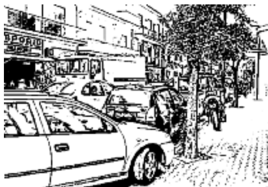
...E LA VIABILITÀ SU STRADA

trolli blandi sull'esposizione del disco orario, così tra gli automobilisti non vi è la percezione di una rigida regolamentazione della sosta: "Visto che non si viene multati - si pensa - si può tranquillamente lasciare l'automobile in zona disco anche oltre i 45 minuti previsti, tanto non succede