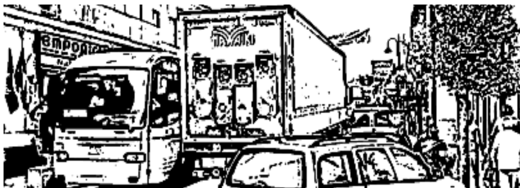
SEMPRE PIÙ ARDUO PER DUE MEZZI PESANTI TRANSITARE PER LARIANO

Questo è il secondo numero del nostro giornale e, come noterete, sono visibili diverse novità. Innanzi tutto, la veste grafica, progettata e curata dall'ottima Angie Vinko che vantiamo come nostra grafica d'eccezione, che riprende la vecchia, cara macchina da scrivere Olivetti Lettera 22, quella dell'epoca d'oro del giornalismo, di quando i giornalisti andavano a caccia di notizie non per denaro ma per la passione di annunciare a tutti la verità: è quello che vogliamo fare noi, guardare la realtà in faccia e raccontarvi i risvolti della vita di tutti i giorni, con l'unico