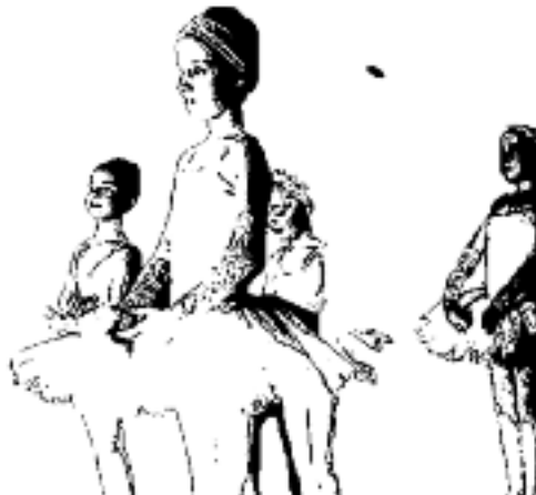
IL CORSO DI DANZA CLASSICA