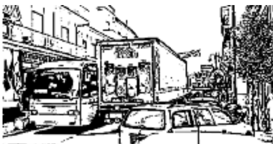
L'ENNESIMO INGORGIO CAUSATO DALL'ERRONEO UTILIZZO DELLA CARREGGIATA

cheggiata male. Il peggio però si è visto quando un tir si è fermato lungo la strada, intasando tutto il centro. La strada ogni giorno è transitata da tir di ogni dimensione che nel centro urbano di Lariano diventano anche pericolosi: le au-