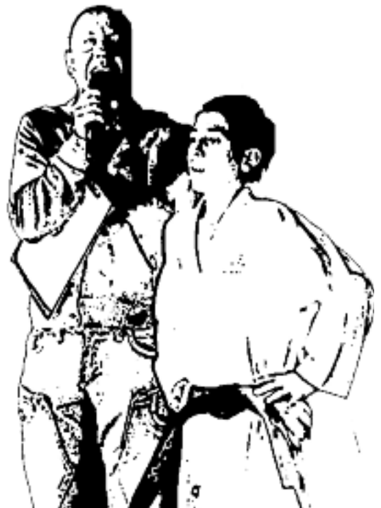
IL CAMPIONE MONDIALE DI KARATE