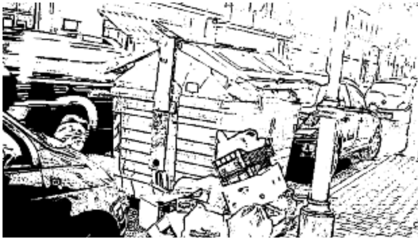
RIFIUTI ACCATASTANTI NEL CENTRO DI LARIANO

Scioperano gli operai della discarica e Lariano rimane con i rifiuti sulle strade. I cumuli di immondizia della scorsa settimana sono stati lentamente rimossi dalla Volsca Ambiente solo da qualche giorno. Il disservizio, a quanto pare, è stato causato dalla chiusura della discarica di Colferro a causa del mancato pagamento da parte del Gaia, degli stipendi degli operai. Nella Valle del Sacco, in-