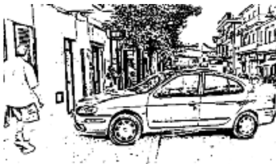
IL PARCHEGGIO SELVAGGIO DANNEGGIA I PEDONI...

Nel centro di Lariano esiste il disco orario ma in pochi lo rispettano. Sono infatti molti gli automobilisti che si fanno gioco della segnaletica verticale, che imporrebbe una sosta massima di 45 minuti, lasciando l'auto m o b i l e parcheggiata lungo via Roma anche per tutto il giorno. Altri invece, noncuranti della necessità di apporre il disco orario, lasciano l'automobile senza segnalare l'orario di arrivo. Così accade che quei parcheggi bianchi che servirebbero a far sosta gratuitamente le automobili pur