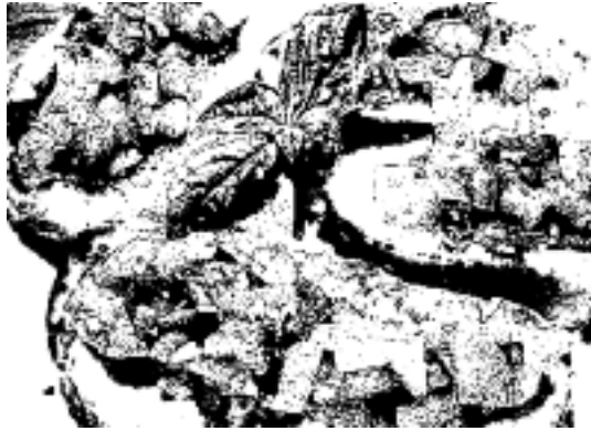
LA PIOGGIA SI È ABBATTUTA SULLA SAGRA

L'acquazzone pomeridiano ha tenuto a casa la tanta gente che avrebbe voluto degustare la bruschetta con il pane di Lariano, così ogni valutazione sull'affluenza è rimandata a questi