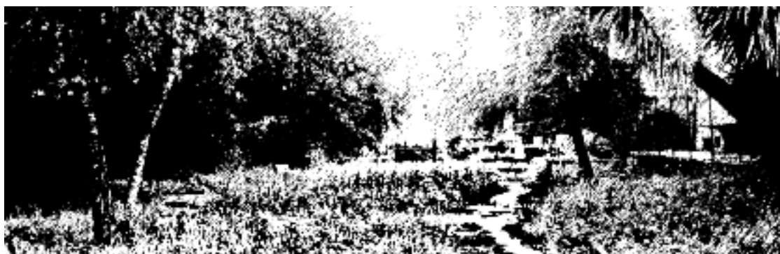
I GIARDINI DI VIA MANZONI

Manutenzione scarsa nei giardini di via Manzoni. Lo spazio verde dietro le case popolari comunali risulta infatti non curato, e lo dimostrano l'erba alta e gli alberi non potati. Quello giardino potrebbe essere un'area in cui poter sostare, riposarsi e scambiare due parole con qual-